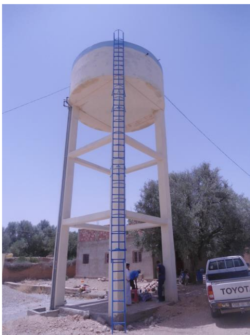
Réservoir Ouled Aabid

Ce projet a pu être réalisé grâce au soutien financier de l'Agence de l'Eau Loire Bretagne, du Conseil Départemental d'Ille et Vilaine, de la Collectivité Eau du Bassin Rennais , qui au total ont assumé 51% des coûts, les collectivités publiques marocaines contribuant pour 49%