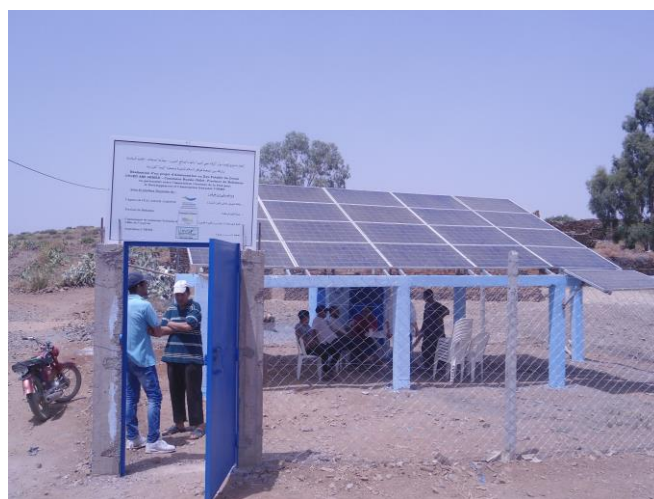
Pompe Solaire Ouled Ami Ahmed

80 foyers, 450 habitants, relève de la commune de Jbilet, à 50 kms au nord de Marrakech. Ce village que l'Orme en 2012 avait équipé pour disposer dans chaque foyer de l'eau potable a vécu, depuis, cinq années de galère et d'espoirs déçus. Rappelez-vous : un puits siphonné par un forage agricole illégal en 2014, le financement par l'Orme, d'un nouveau puits, sans succès, aucune arrivée d'eau; la découverte de deux nouvelles ressources en eau : hélas, l'égoïsme des propriétaires des terrains en a interdit l'exploitation. Finalement, ce sont les habitants de Ouled Ami Ahmed qui ont réussi le miracle : obtenir d'un généreux donateur local deux essais de forage dont l'un, presque au centre du village, s'est révélé positif ! Grâce à l'Agence de l'Eau Adour Garonne ( 28000 euros, soit 51 % des coûts ) , nous avons pu transformer le forage d'exploitation, l'équiper d'une unité de pompage solaire, réhabiliter le château d'eau de 25 m 3 , l'administration provinciale prenant en charge la réhabilitation de tout le réseau de distribution . En août, tous les foyers ont pu rouvrir leur robinet.