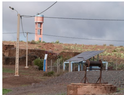
Pompage Solaire Ouled Ami Ahmed